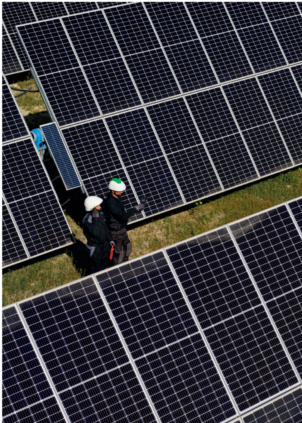
Tournées sécurité conjointes - Novembre 2021