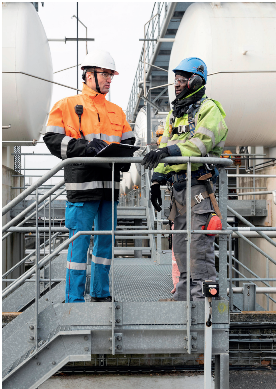
Tournées sécurité conjointes - Novembre 2021